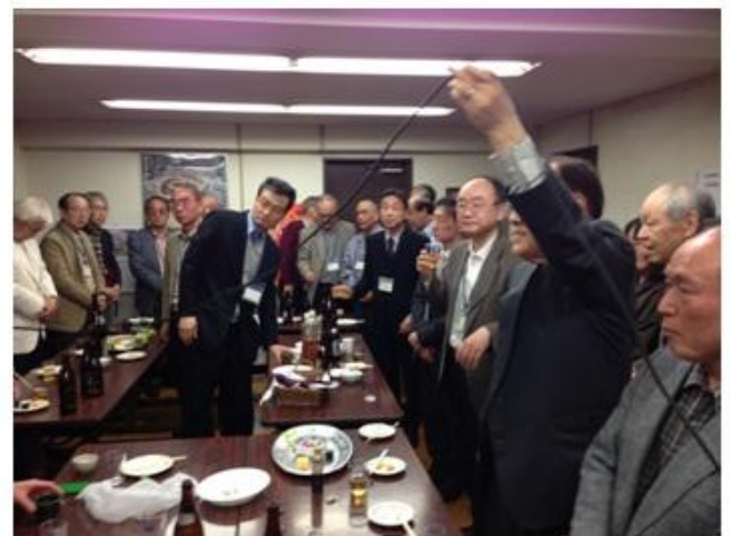
4/11(木)の「東京新潟県人会館」でのサロン