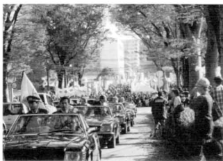
クラシックカーパレード

更に主会場には「ふるさとパザール」が開催され、近隣地域をはじめ長野、新潟、山形、静岡、石川、島根、鹿児島、福島、宮城などの物産には、故郷を偲ぶ懐かしさで大人気です。イベント開催期間に実施されるクラシックカー1三百余台のパレードは圧巻と言うべきものです。 近年では、三十万人を超える賑わいとなりました。また、昨年は「がんばれ東日本」をテーマに、また新潟震災の時には、会場で募金をするなど、少しでも社会貢献になれば・・・との活動も行ってあります。