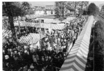
ふるさとパズル会場

「いちよう祭り」は、この見事な環境を皆で楽しもうと、行政の支援を頂きながら、地域の町内会をはじめ、各種の市民活動団体、学生会、企業、商店街などの団体が参加し、自由な発想とアイデアで企画し実施しています。また、警察当局の交通指導も頂き、安全で楽しいイベントを目指しております。主なイベントは、沿道の十二町内会の「関所」の宿場焼印を押しながら黄金街道を散策し、終点の「代官所」で完歩賞を獲得する「通行手形ラリー」です。地元ファンの方から提供頂き、第一回目からの完歩焼印手形の記念品が本部に陳列されています。