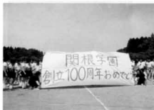
100周年記念 体育祭 平成21年6月12日実施