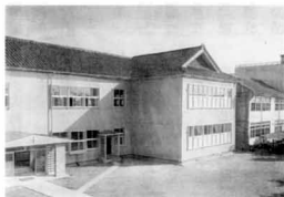
高田女子実業高等学校 高田北辰高等学校(女子部) (北辰高校 校舎)