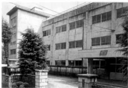
高田北辰高等学校(男子部) 関根学園高等学校(金谷校舎) (関根学園 校舎)