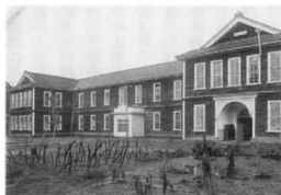
高田高等裁縫女学校 (裁縫女学校 校舎)

昭和53年4月1日 高田北辰高等学校と高田中央女子高等学校を統合し関根学園高等学校と改称 昭和54年10月31日 創立70周年記念式典 平成元年4月 上越市大真1325-11に新校舎完成 平成元年10月7日 創立80周年記念式典 平成6年3月31日 新グラウンド完成 平成11年11月20日 創立90周年記念式典 平成14年8月29日 多目的室その他増築工事完成