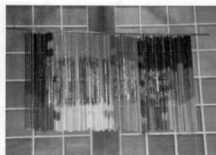
100周年記念 学園祭 平成21年10月24,25日実施 折り鶴(17000羽)をアートを全校生徒で作成