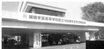
当日の上越文化会館

とが記されています。その後、幾多の校名の変更や学科の改廃、校舎の移転改築など幾多の困難を乗り越え、現在は金谷山麓の校舎に六百名を超える生徒が集う学校となっています。文武両道の活躍により、地域からは確かな私学として信頼され進化を続けています。これもひとえに、二万一千有余名の同窓生の活躍、在校生の活躍、歴代の理事長、学校長をはじめ先輩教職員の御努力並びに地域の方々をはじめ関係各位の御支援のお陰によるものと感謝しています。 (一) 数年、保護者や兄弟が卒業生であつたり、親戚に卒業生がいたりするなど何らかの形で関根学園と関わりを持つる生徒が各クラスに十人以上在籍しています。地域に育てていただいた今までの百年に感謝し、これからの百年も生徒一人ひとりを大切にすることを全ての教育