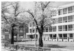
高田中央女子高等学校 (昭和53年4月~) 関根学園高等学校(西城校舎) (中央女子 校舎)