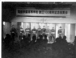
記念祝賀会 木遣りでスタート