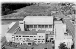
関根学園高等学校(平成元年4月~) (航空写真)