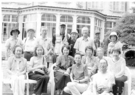
岩崎邸での記念写真